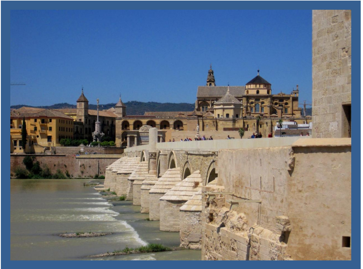
Puente romano sobre el río Guadalquivir a su paso por la ciudad de Córdoba